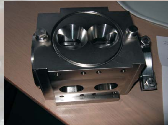
Dozowniki oraz płyty grzewcze (Waldner, Hugart, Mlecz-Masz, Ampak, Multivag)